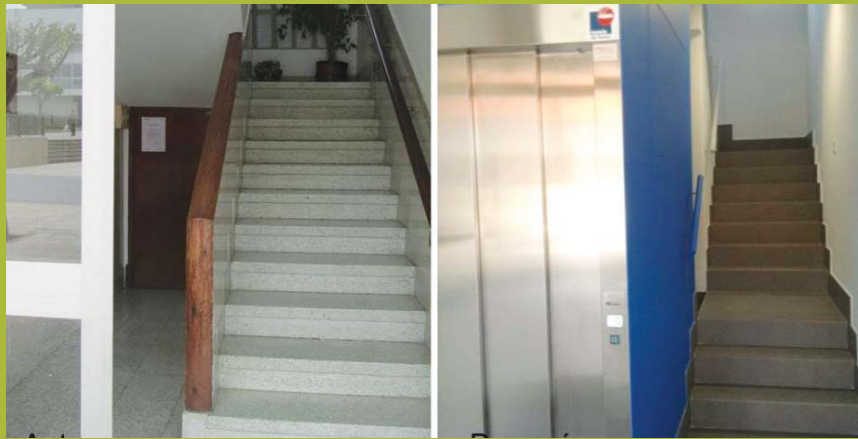
Instalación ascensor calle Bosquecillo