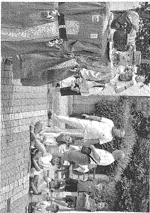
Los más pequeños en el primer día de fiestas de Beriáin. CALLEIA