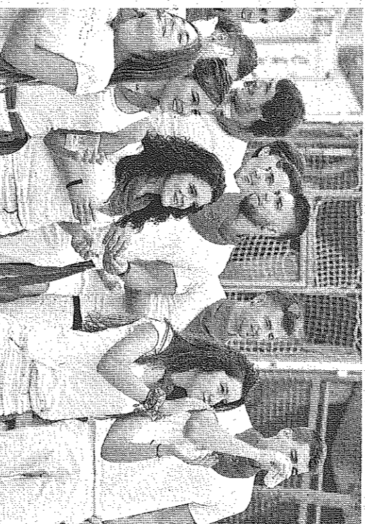
Una cuadrilla de amigos durante el chupinazo. CALLEIA