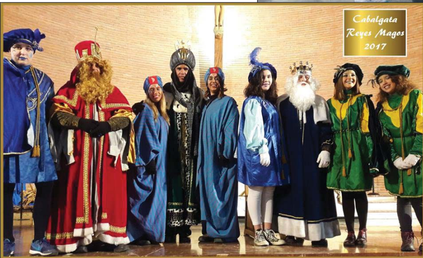
Cabalgata Reyes Magos 2017

Otro acto destacado de las navidades fue el desfile de la Cabalgata de los Reyes Magos, seguida con ilusión y devoción por los más pequeños del pueblo. En la tarde del 5 de enero, Melchor, Gaspar y Baltasar, llegaron a la iglesia de San Martín, en el Casco Antiguo, donde fueron recibidos en un templo totalmente abarrotado. Desde allí un multitudinario desfile les condujo hasta la Iglesia de Santo Cristo del Perdón, en el Casco Nuevo, recibiendo los vítores y aclamaciones del público congregado a su paso.